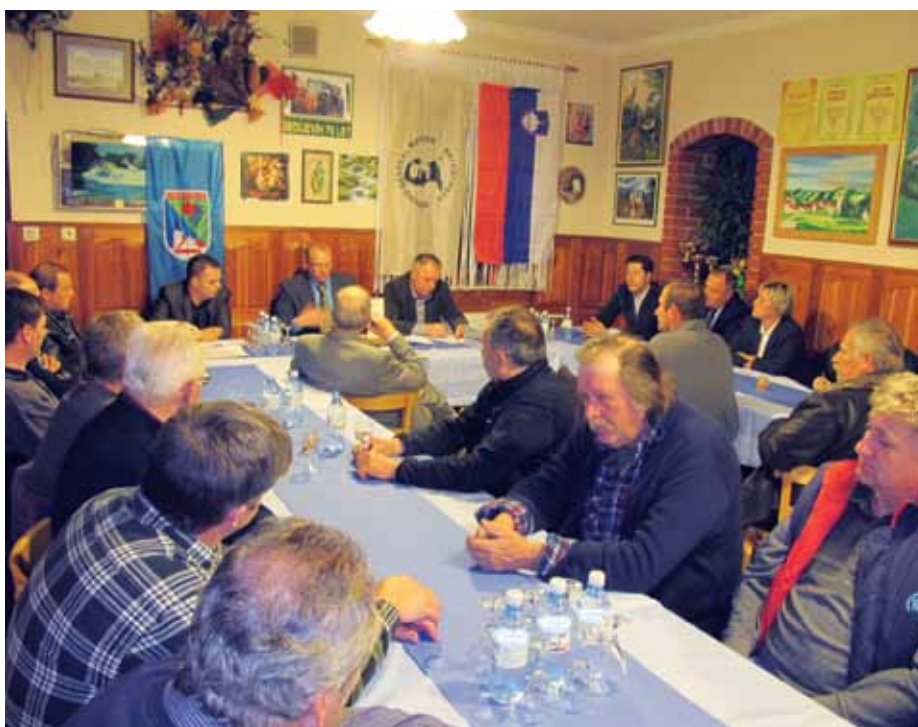
Na občnem zboru društva se je zbralo veliko članov in gostov.