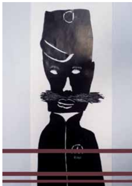
Nagrajeni prispevki dijakov osnovnih šol iz Zasavja, ki so se udeležili nagradnega natečaja z naslovom "Domovina in svet".