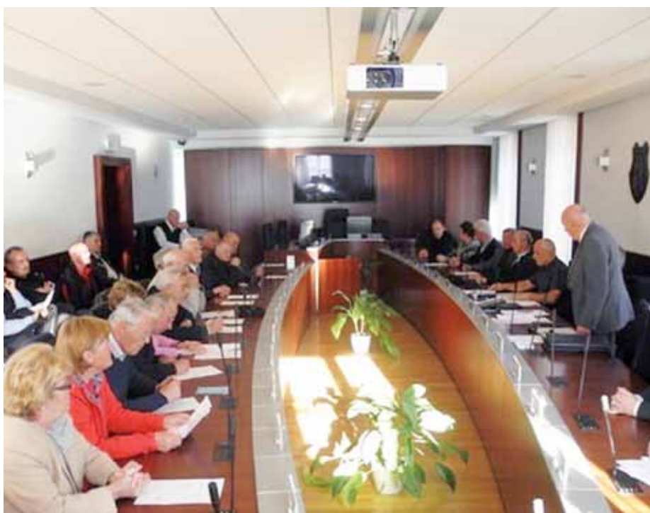
Udeleženci letne skupščine DGM Kamnik