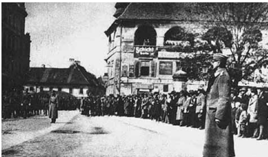
Slika 5: Maister ob pregledu čet v Mariboru