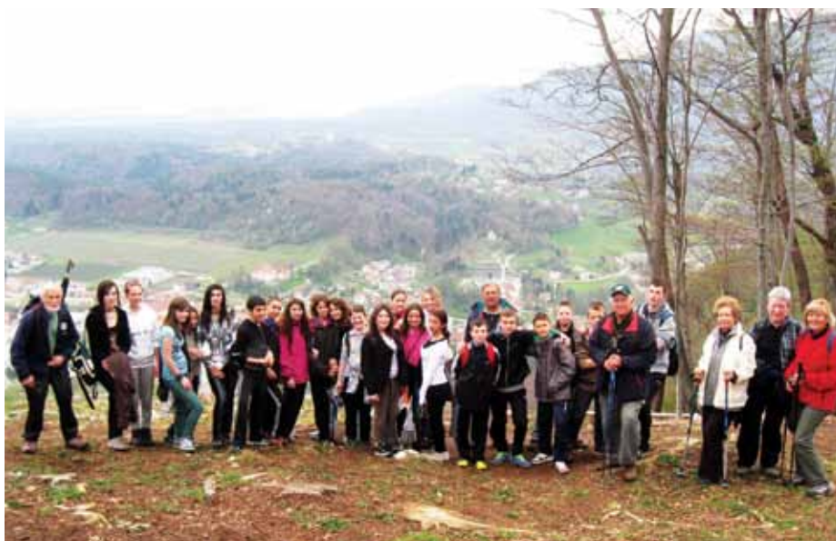
Med stotnijo letošnjih Maistrovih pohodnikov na Veliko špico nad Kamnikom je bilo tudi veliko mladih iz OŠ Marije Vere na Duplici...

prenesli najboljše želje in iskrene čestitke. Imenovani je za te namene pripravljen odstopiti nekaj eksponatov iz Maistrovega obdobja. Med nalogami društva velja omeniti prizadevanje za zbiranje gradiva za Maistrovo spominsko sobo, sodelovanje v programu ob občinskem prazniku in dnevu Rudolfa Maistra, sodelovanje s Šolskim centrom Rudolf Maister in z Medobčinskim muzejem Kamnik ter organizacijo letnega srečanja članov DGM Kamnik.