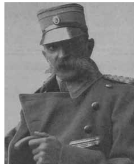
Slika 2: General Rudolf Maister na naslovnici Naše slike