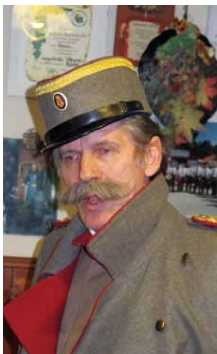
General Maister v Cerkvjenjaku.

Člani društva so na občnem zboru soglasno potrdili poročilo o opravljenem delu v letu 2011 in sprejeli program dela za letošnje leto. Med drugim bodo v času občinskega praznika pripravili pohod po severni meji občine Cerkvjenjak, septembra pa bodo organizirali pohod do razglednega stolpa generala Maistra. Ob obletnici priključitve Maribora tedanji Jugoslaviji pa bodo v goste povabili pisatelja Toneta Partljiča. Poleg tega bodo izvedli še več drugih