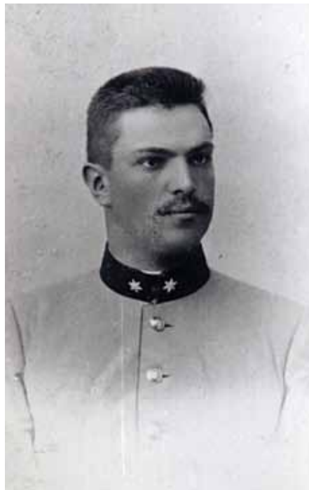
Slika 4: Rudolf Maister, domobranski poročnik (odlok, 27. 10. 1895)

Če se vrnem k Maistru, leta 1906 se je šolal na častniški šoli 3. armadnega zbora v Gradcu. Šolo je uspešno zaključil leto kasneje, kar mu je omogočilo napredovanje na položaj stotnika. Leto 1908 je bilo za Maistra zelo težko. Septembra tega leta je bil na Ptuj organiziran shod narodnozavedne Družbe svetega Cirila in Metoda. Ta shod je seveda šel v nos nemškimi nacionalistom, ki so udeležence grobo napadli. V odgovor na napad so naslednji dan v Ljubljani potekale demonstracije,