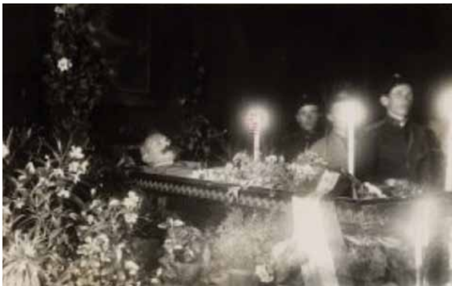
Slika 3: Maister na mrtvaškem odru

Po uspešno zaključenem šolanju se je vrnil v Celovec. Med svojim služenjem v Celovcu je imel zaradi svojih domoljubnih nazorov večkrat