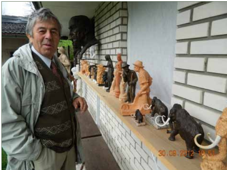
Največje Kačevo delo: Neveljski mamut čaka...

mesta bojijo, do intimnih miniaturnih portretov slovenskih mož in žena se vidi tudi Kačev odnos do lastnega ustvarjanja. Izvor navdih