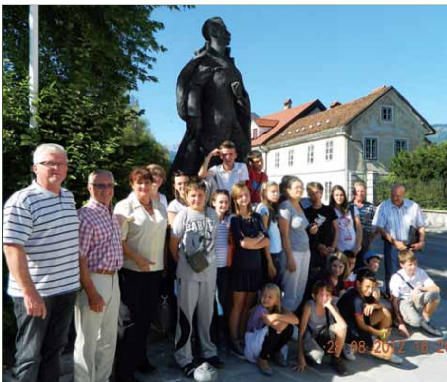
Začetek Maistrove poti pred spomenikom Rudolfa Maistra v Kamniku

Mladi gosti iz Sarajeva so se po prihodu v Kamnik v zgodnjih popoldanskih urah najprej zapeljali v dolino Kamniške Bistrice, po kosilu in ogledu lepote bistriške doline so se veselo razpoloženi ob petju slovenskih pesmi vrnili v Kamnik, kjer so jih pred spomenikom Rudolfa Maistra v Kamniku pozdravili