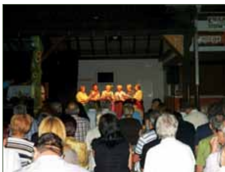
Predstavitve dogajanja v letu 1943