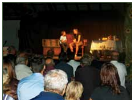
Predstavitve dogajanja v letu 1945