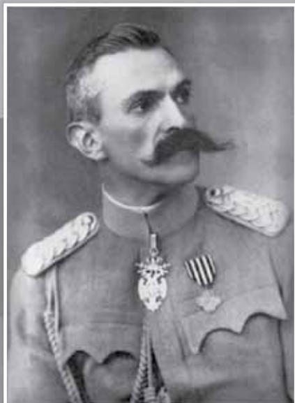
Rudolf Maister - Vojanov, slovenski general in pesnik, 1874 - 1934

Bratje! Naša pomlad gre iz tal, bistra ko burja, močna ko val: v naša domovja se je zagnala, tmo' razklala, sonce skovala, sonce - kralja Matjaža dan.