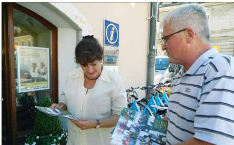
Maistrov glas bo šel tudi med naše rojake v Bosno in Hercegovino...