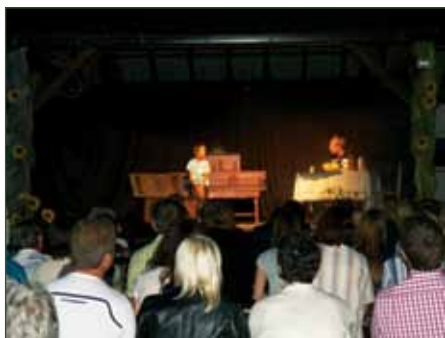
Predstavitve dogajanja v letu 1938

Veseli smo, da smo lahko počastili napore naših prednikov za našo domovino, našo Slovenijo, ki jo imamo radi in smo nanjo ponosni. Obiskovalce smo po končanem kulturnem programu pogostili z dobrotami iz »nove« kuhinje.