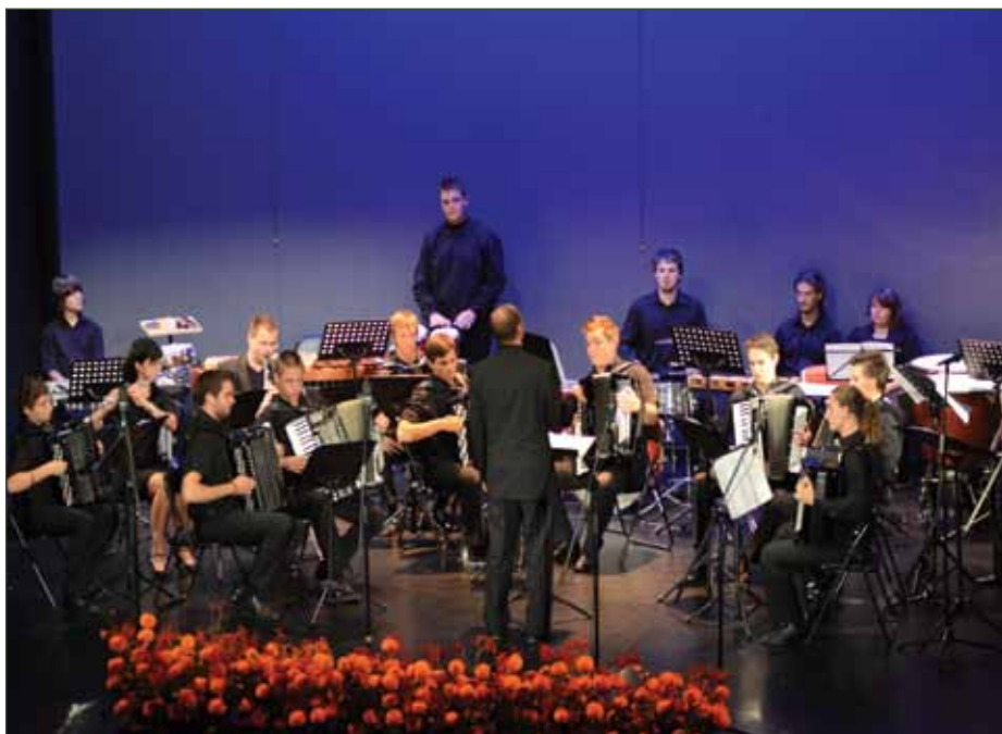
Proslava ob 20-letnici priključitve