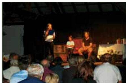
Predstavitve dogajanja v letu 1955