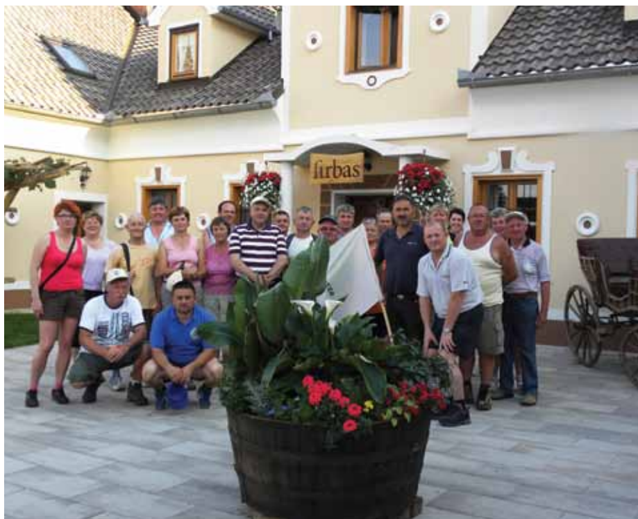
Udeleženci tradicionalnega pohoda »Po severni meji občine Cerkvjenjak«, v sklopu občinskega praznika Občine Cerkvjenjak.