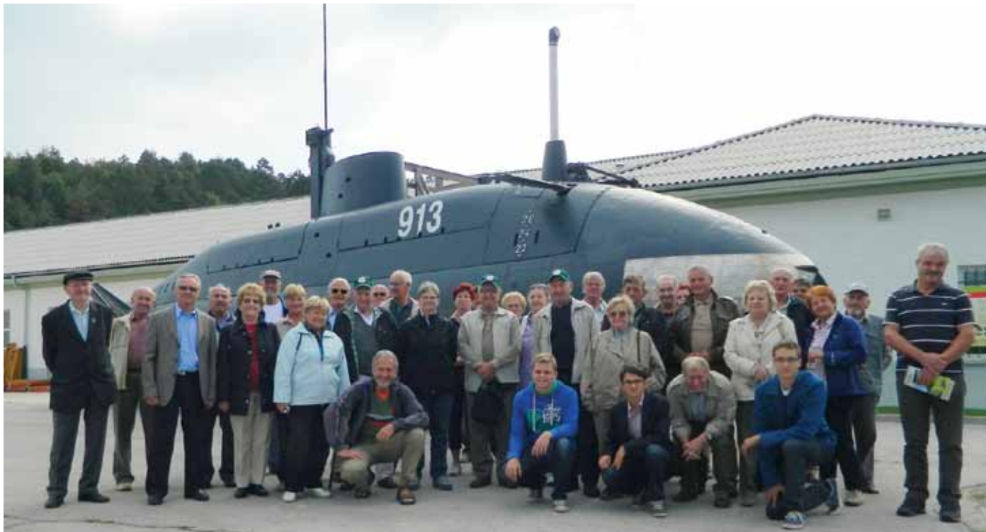
Zanimiv je bil tudi ogled podmornice v vojaškem muzeju v Pivki

Med donatorji, ki so vpisani v spomin-ske plošče na ploščadi pred spomeni- kom, je tudi Zveza društev generala Maister, preko katere smo svoj prispe- vek za spomenik namenili tudi člani DGM Kamnik.