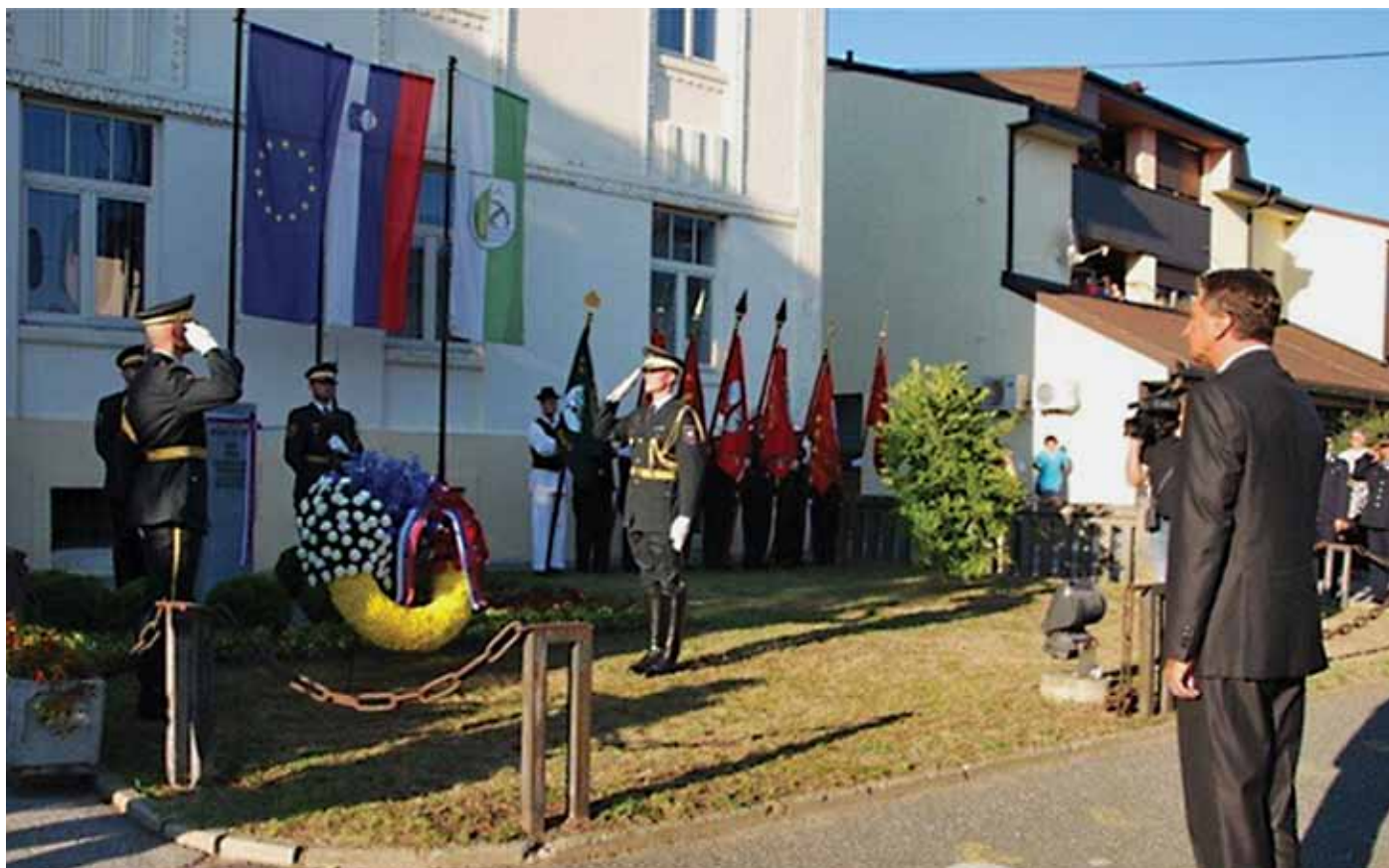
Predsednik države RS Borut Pahor