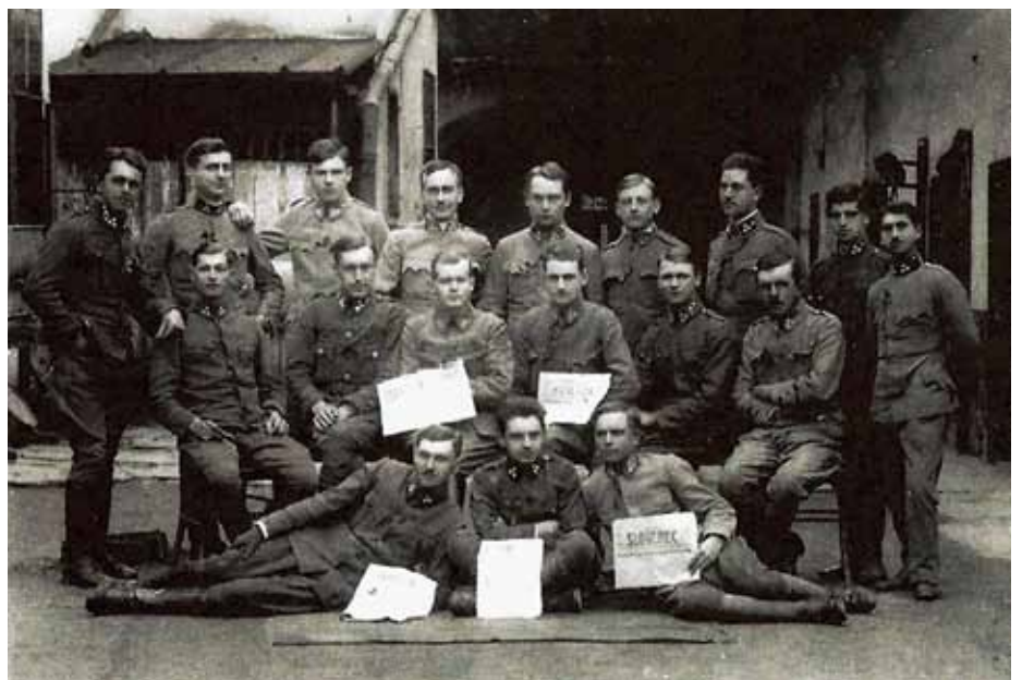
Udeleženci podoficirskega tečaja Majstrovih borcov v Velikovcu leta 1918

Okrog 17. ure smo dospeli v Ljubno in se tu nastanili v veliki sobi gostilne Benda, kamor je občina hitro dostavila slamo za ležišča, pred hišo pa je bila urejena kuhinja. Še zvečer je bila vzpostavljena