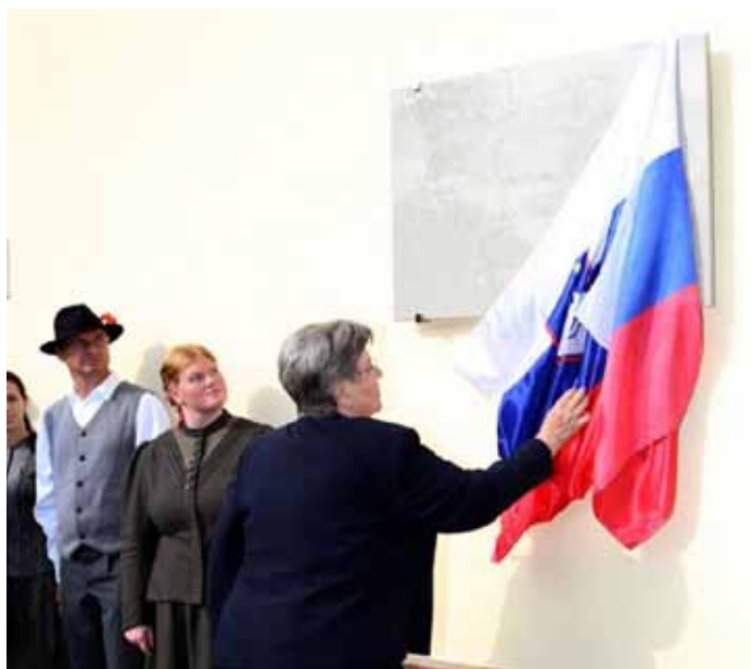
Odkritje spominske plošče