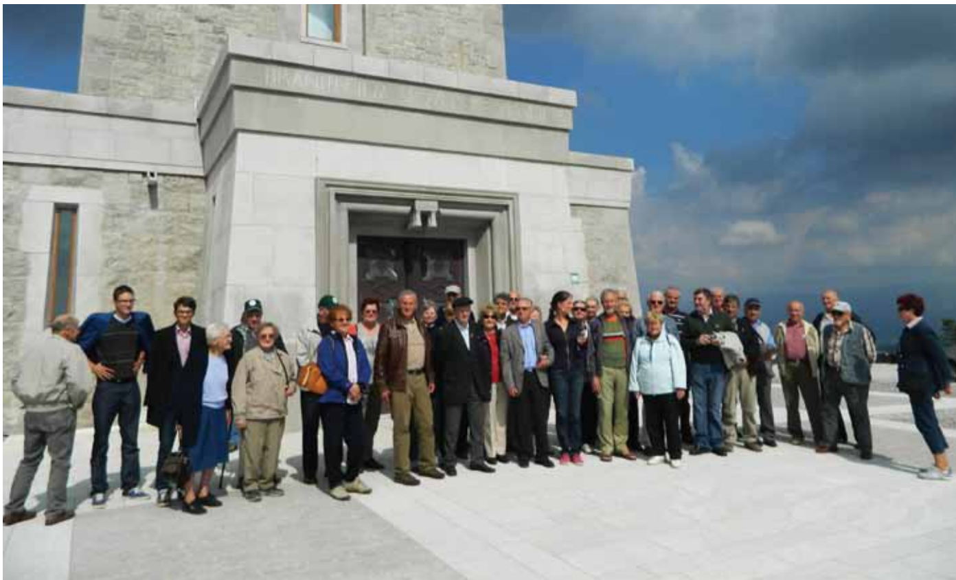
Člani DGM Kamnik pred spomenikom na Cerju

Obogateni z novimi spoznanji o naši zgodovini in zadovoljni s prijetnim izletom, ki mu je botrovalo tudi lepo jesensko vreme, smo se proti večeru vrnili v Kamnik.