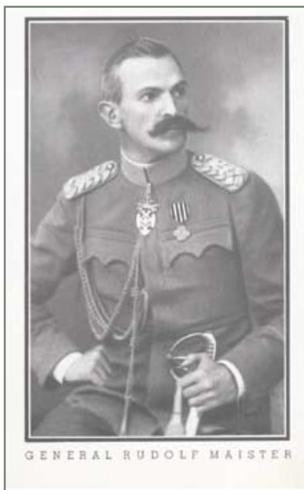
General Rudolf Maister – portret s sabljo.

V več kot desetih letih službovanja v Ljubljani je na vajah v premikanju vojske premeril slovensko ozemlje in se tako dodobra seznanil z ozemljem, kjer so živeli Slovenci. Neposredno spoznavanje terenov na Štajerskem in Koroškem mu je ob koncu prve svetovne vojne prišlo še kako prav. To je bilo tudi obdobje, ko je izdal pesniško zbirko Poezije, ko si je začel ustvarjati bogato knjižnico in ko je kot talentiran slikar začel tudi slikati.