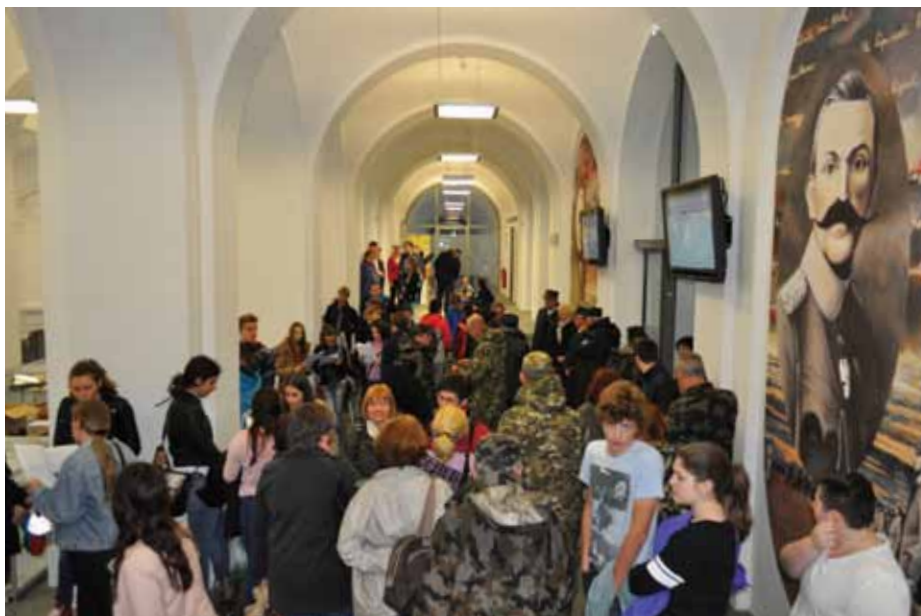
Udeleženci kviza in poslušalci v Kadetnici