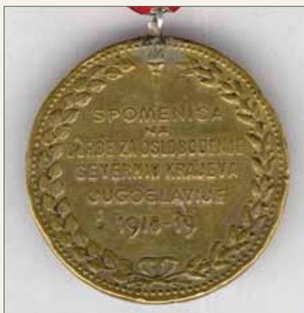
Zadnja stran spomenice