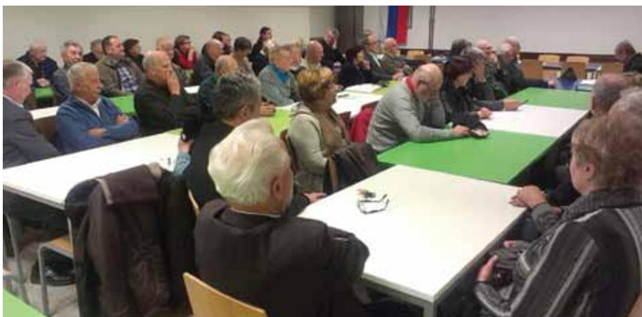
Marca smo izvedli letno skupščino, na kateri smo pregledali rezultate lanskega dela in ugotovili, da je bil program dela v celoti realiziran.

V juniju si bomo ogledali še dvorec Bukovje in stalne razstave o dogodkih iz slovenske osamosvojitvene vojne. Septembra se bomo podali na ekskurzijo, o kateri bomo poročali v eni izmed naslednjih številok Maistrovega glasu.