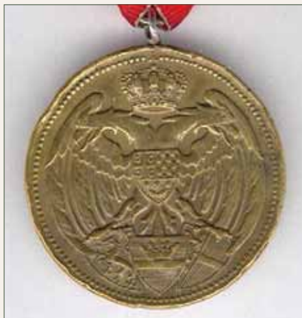
Sprednja stran spomenice

SPOMENICA je ustanovljena 10. 10. 1939. leta in so jo podeljevali osebam, ki so od 29. 10. 1918 pa do 5. 5. 1920 sodelovali v bojih za pridružitvev Koroške, Štajerske, Prekmurja in Medžimurja k