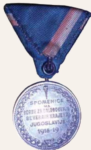
Trak za neborce

Trak za borce je rdeče barve in ima v zgornjem levem vogalu modro-bela trakova širine 3 mm, kar predstavlja jugoslovansko državno zastavo. Pravico do podelitve medalje za borce so imeli samo tisti, ki so v času med 29. 10. 1918 in 5. 5. 1920 sodelovali pri osvobajanju Koroške, Štajerske, Prekmurja in Medžimurja pod poveljevanjem Rudolfa Maistra, tedaj še ma-