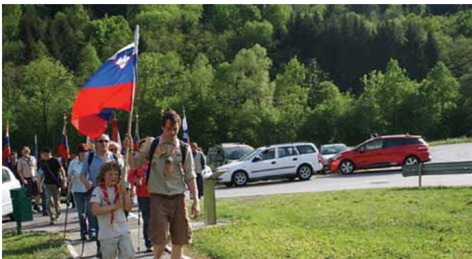
Na prizorišče pa so pred proslavo prišli tudi pohodniki, ki so se že prej podali po Malgajevi poti.