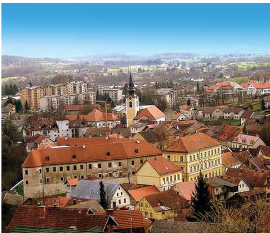
Metlika, mesto pod Gorjanci, ima mestne pravice že 680 let

družna vinska klet pokriva celotno vinogradniško območje vinorodnega okoliša Bele krajine. V belih vinih prevladujeta laški rizling in kraljevina, v rdečih pa modra franinja in žametna črnina ter mlada