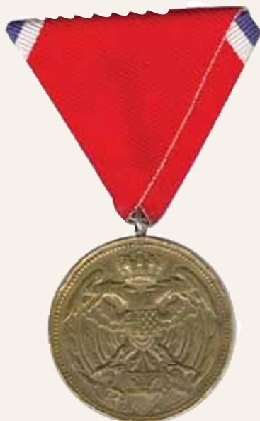
Trak za borce

Skupaj s spomenico je prejemnik dobil tudi diplomu.