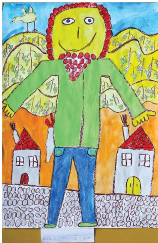
Boris Mutić: Ilustracija Maistrove pesmi Sveti Martin