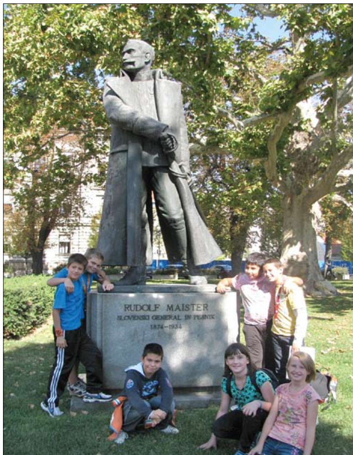
Pred Maistrovim spomenikom