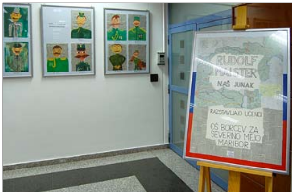
Likovna razstava Maister – naš junak, MORS, Ljubljana