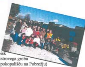
- obisk Maistrovega groba (na pokopališču na Pobrežju)