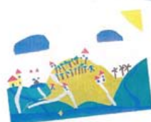
- ilustracije Maistrovih pesmi