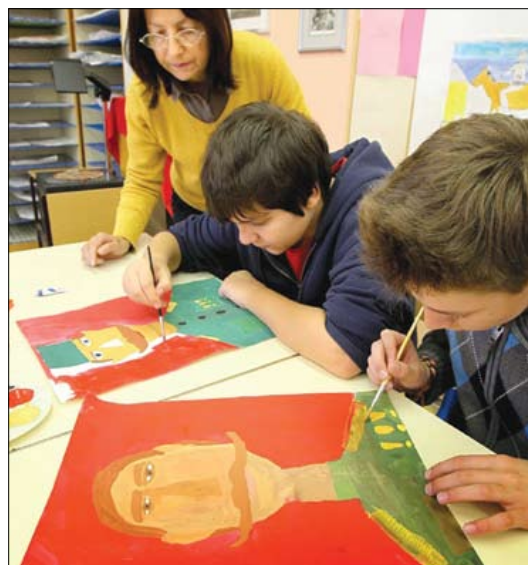
Učenci med likovnim ustvarjanjem na temo Rudolfa Maistra