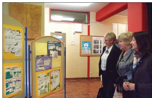
Otvoritev likovne razstave po svečanosti