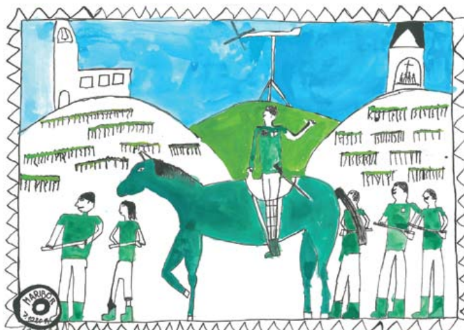
Jan Fras: Rudolf Maister v Mariboru