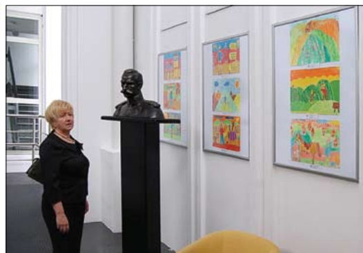
Likovna razstava Maister – naš junak, MORS, Ljubljana

Četrtušolci so se pridružili projektu Maister, naš general in poet kot najmlajši učenci drugega vzgojno-izobraževalnega obdobja. Nam, učiteljicam četrtušolcev, je bil to izziv. Sprva smo se ga lotile z veliko pomisleki, saj je devetletnikom tema prve svetovne vojne, Maistra in njegovih borcev ter meje za severno mejo tuja. Pa vendar. Naš pedagoški čut, kako na enostaven in starostni stopnji primeren način vključiti četrtušolce v projekt, je bil uspešen. To nam potrjujejo pohvale gostov, sodelavcev, staršev