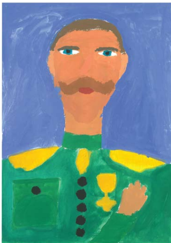
Nejc Gole: Portret Rudolfa Maistra