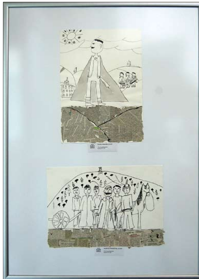
Razstava na MORS-u