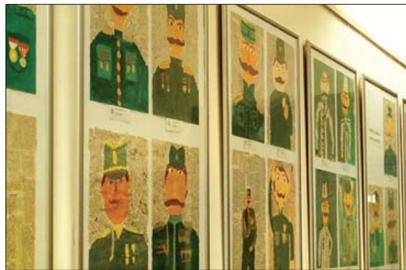
Likovna razstava Maister – naš junak, MORS, Ljubljana

ki jo odprl minister za obrambo, kulturni program pa so pripravili naši učenci. Predstavili smo ciklus otroškega ustvarjanja na temo Rudolf Maister, naš junak. Opredelili smo se za pet tematskih sklopov: portreti generala Maistra, Rudolf Maister v Mariboru, strip Kaj vem o Rudolfu Maistru, ilustracije Maistrovih pesmi Slovenske gorice in Sveti Martin;