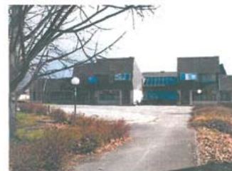
VAROVANJE KULTURNE DEDIŠČINE