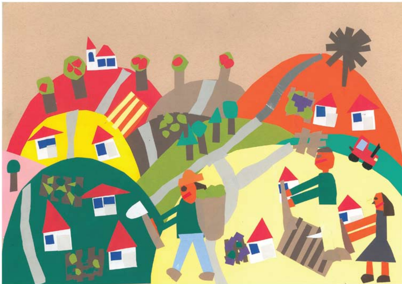
Žiga Lah: Slovenske gorice (ilustracija pesmi)