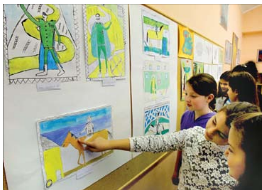
Učenci občudujejo nastala dela