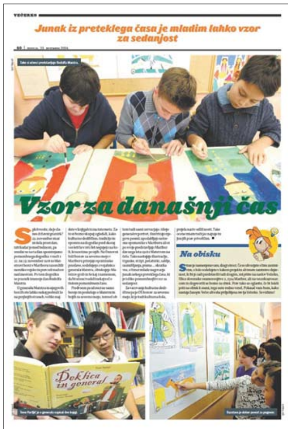
Večer (23. november 2014, rubrika Večerko)