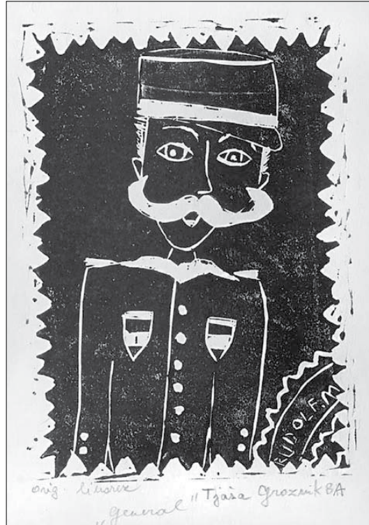
Tjaša Groznik: Portret