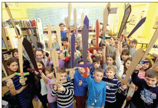
Maistrove sablje v nastajanju