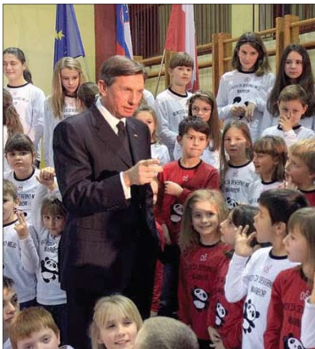
Borut Pahor med otroki OŠ borcev za severno mejo Maribor

Zavoljo njega in borcev za severno mejo smo Slovenci znova napeli, ne pa popustili zgodovinski lok našega narodovega obstoja, vse do polne suverenosti. Da bi narodno in državno samostojnost končno tudi dosegli, smo morali potem, po Maistru, v naš bran še dvakrat poseči po orožju. V času druge svetovne vojne in vojne za samostojno Slovenijo. Kar trikrat v enem samem stoletju smo se morali izkazati s svojo vojaško upornostjo.